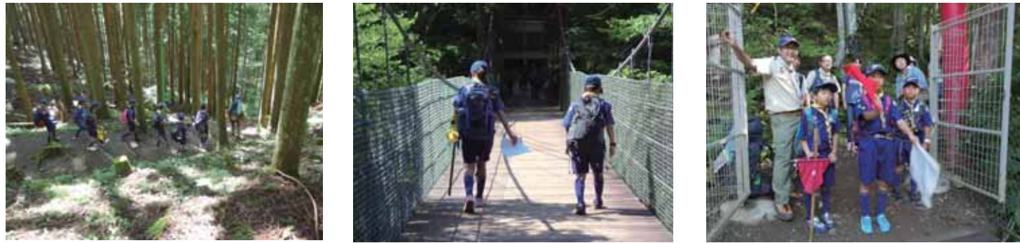
キャンプ場までは試練の坂！崖を下ります。組長が吊り橋の安全を確認して残ったスカウトに手旗信号で誘導