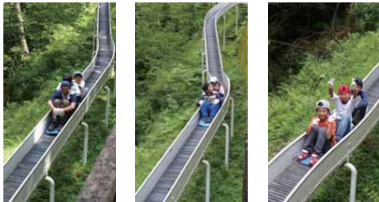
リーダーもスカウトも楽しんだ日本一長いローラー滑り台