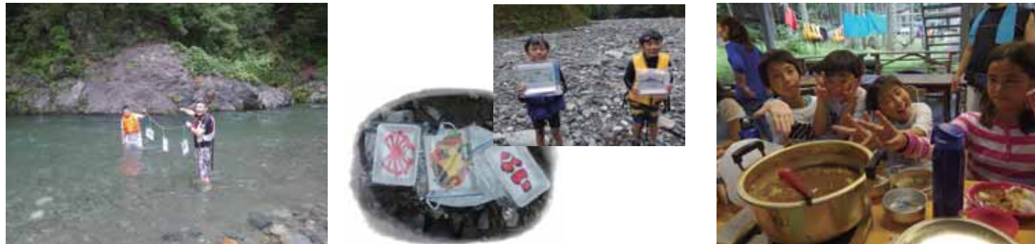
キャンプ場の川で晩御飯のカレーの具材争奪戦！大きな魚を取れば、良い食材をGetできる