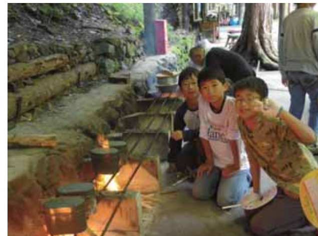
今年の夏キャンは、山梨県丹波山村の甲武キャンプ村は施設が整備され川も近く緑が多く自然がいっぱいでした。