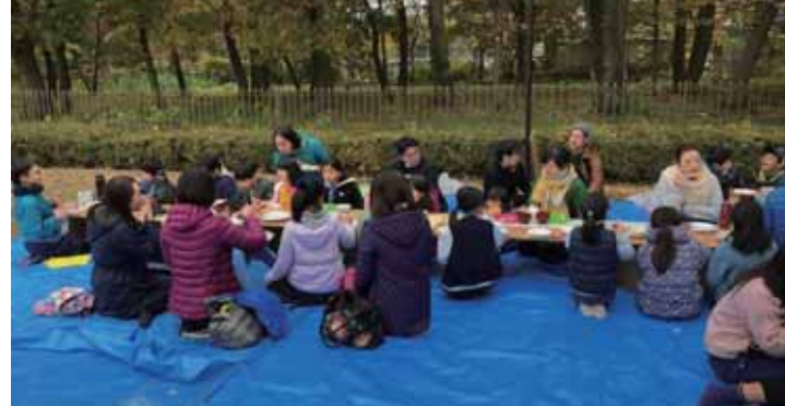
つきたてのおもちは、たくさんのゲストのみなさんと一緒に頂きました