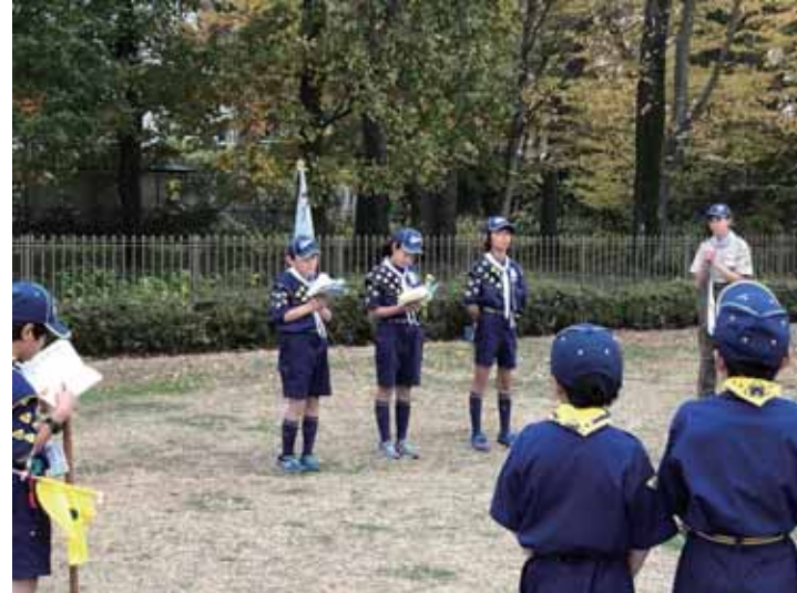
もちつき終了後実施された4月にボーイ隊に上進する月の輪隊の結隊式